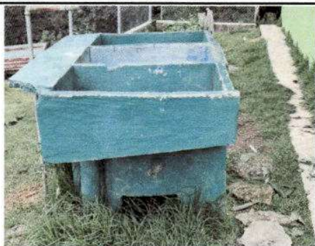
Foto1: Sustitucion de pila con daño por pila de cemento de dos lavaderos