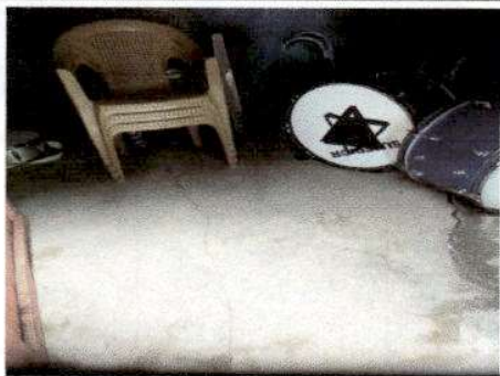
Foto 7: Sustitución de piso de torta de cemento por piso de granito