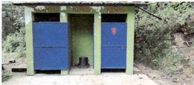
Foto 3: Mantenimiento a estructura (lijado, aplicación de pintura) a 3 puertas de servicios sanitarios