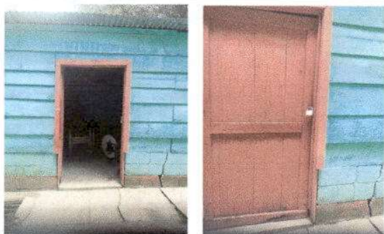
Foto 5: Sustitucion de puerta de madera por puerta de metal para mayor seguridad