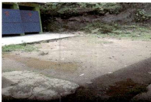
Foto 8: Reparación de planchas de concreto en mal estado por torta de cemento de patio, frente a los baños