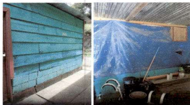
Foto 4: Sustitucion de muro de madera dañada por muro de lamina lamina lisa