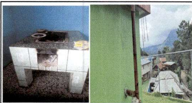
Foto 2: Sustitucion de chimenea de metal dañada por chimenea de ladrillo