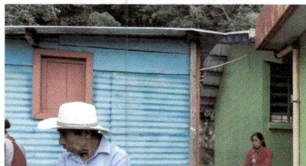
Foto 10: Sustitución de techo de lamina en mal estado por lamina troquelada

Observación: Si es necesario se pueden agregar hojas adicionales y actualizar el número de hojas.